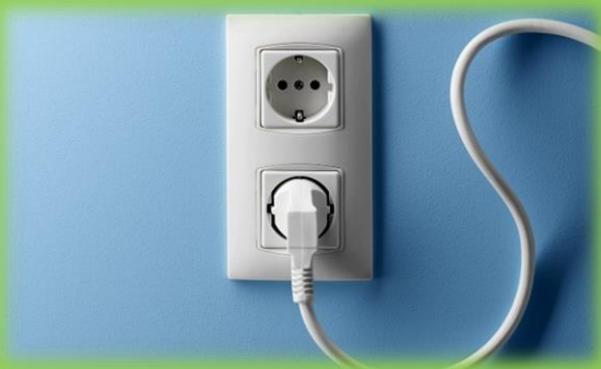
Вилка в розетку