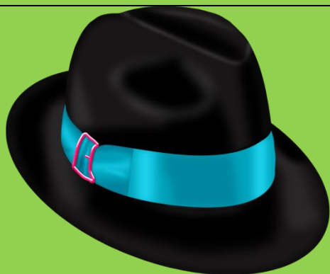
Шляпа на голову

Дорисуй значение второго слова. Снизу подпиши значение.