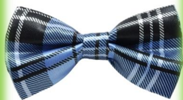
Бабочка на рубашку