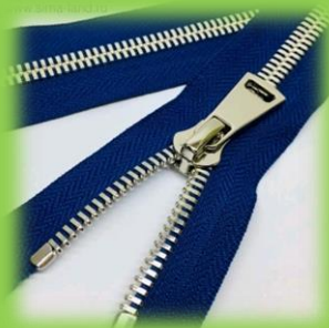
Молния на курточке